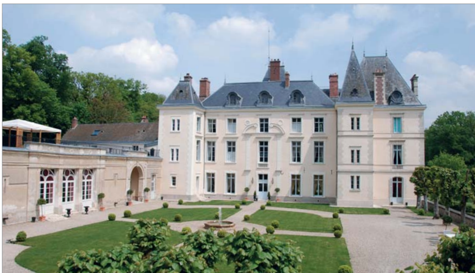
A 47 km de Paris, au cœur de 17ha, château d'origine 12 ème S., remanié