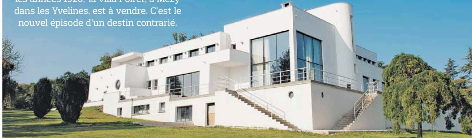
La villa Poiret s'étend sur 800 m 2 . et compte 1000 m 2 de terrasses et de toits-terrasses. AGENCE PATRICE BESSE

PATRIMOINE Construite dans les années 1920, la villa Poiret, à Mézy dans les Yvelines, est à vendre. C'est le nouvel épisode d'un destin contrarié.