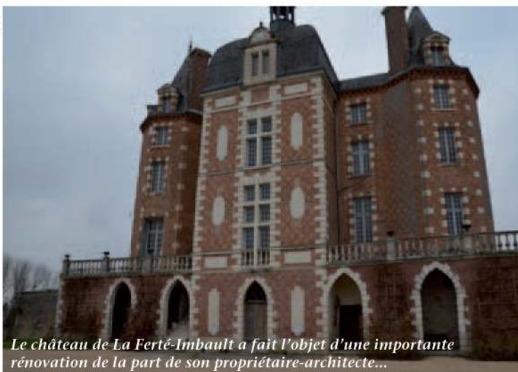
Le château de La Ferté-Imbault a fait l'objet d'une importante rénovation de la part de son propriétaire-architecte...