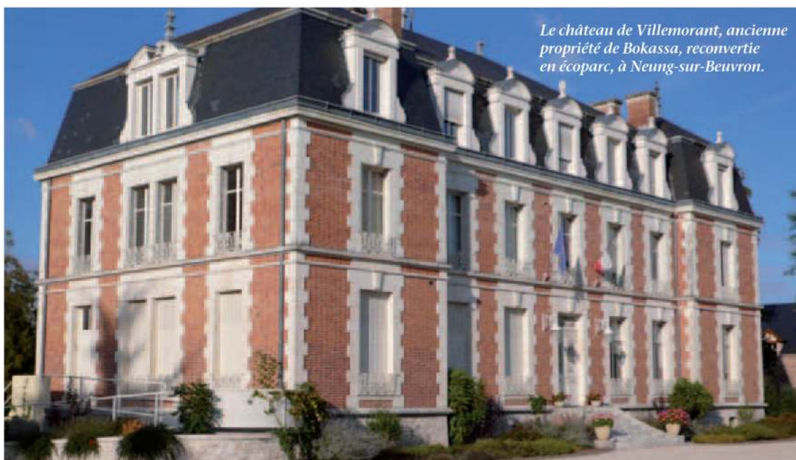
Le château de Villemorant, ancienne propriété de Bokassa, reconvertie en écoparc, à Neung-sur-Beuvron.