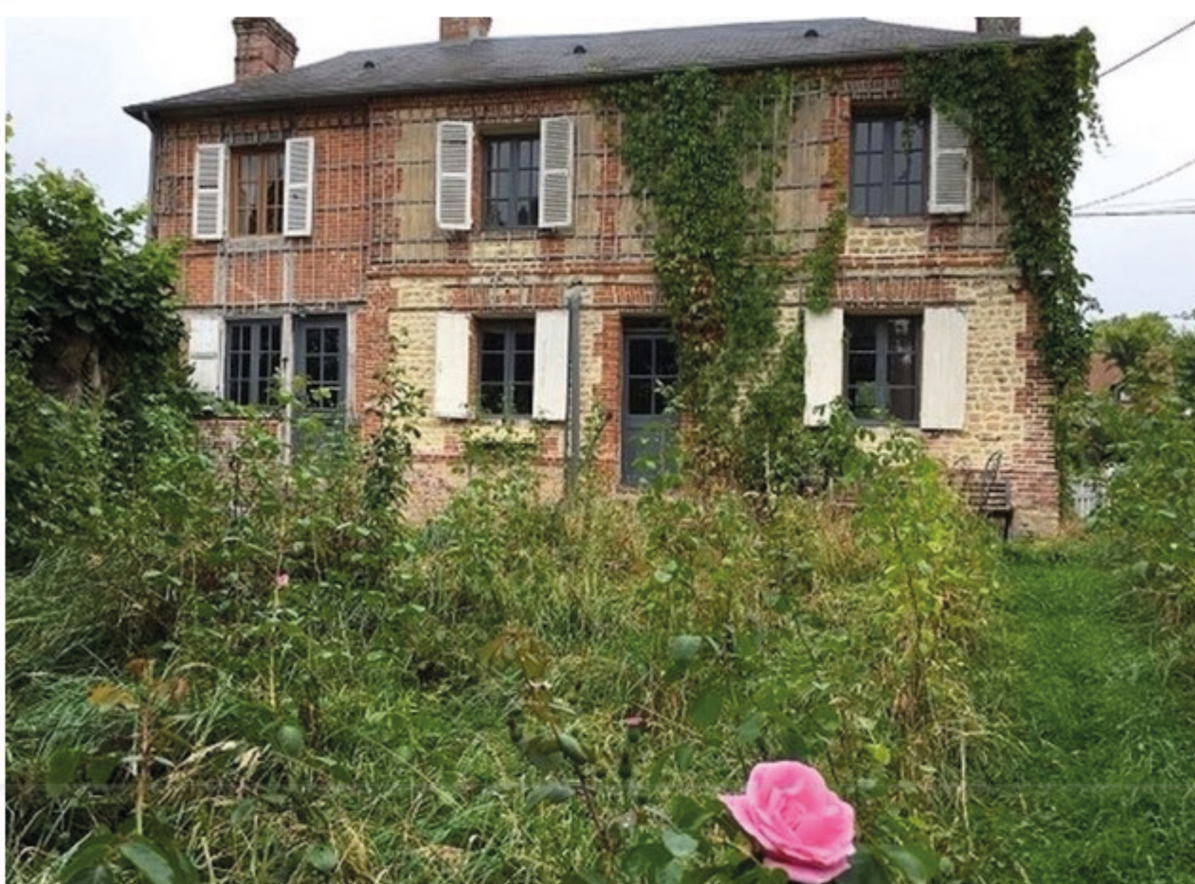
La maison est située à 12 kilomètres à l'Ouest de Lisieux

28/04/2017 à 10:28 par christophelemoine