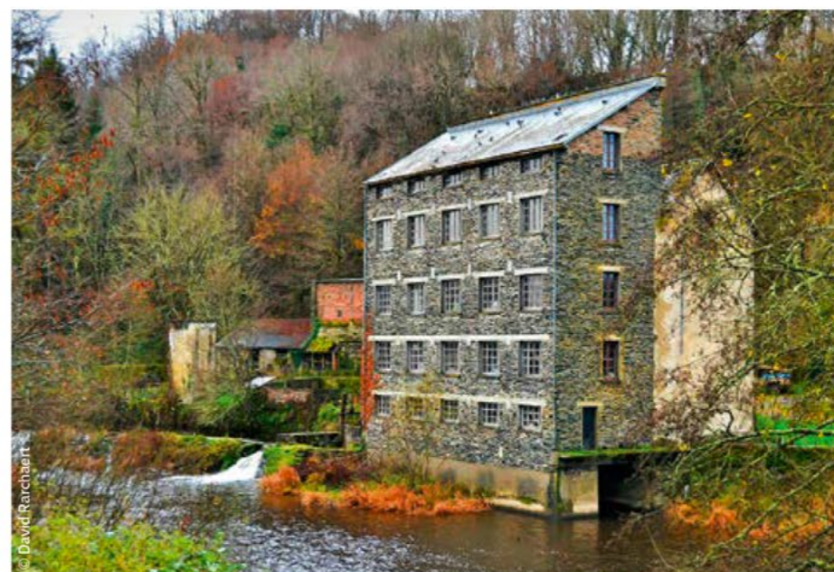
Château en ruine, chapelle désaffectée, ou « immeuble » du XIX e , les acheteurs actuels « craquent » souvent pour créer un projet original dans un immeuble atypique.